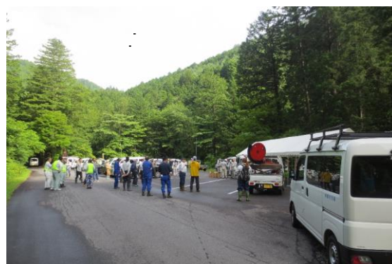
作業前のミーティング