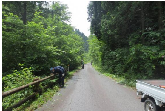
林道沿線の草刈り作業