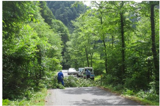
林道沿線の危険木除去