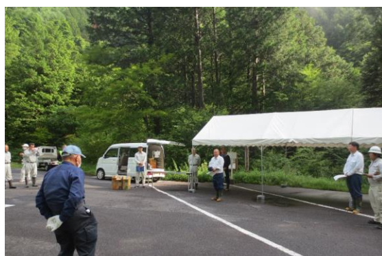
南木曾支署長のご挨拶