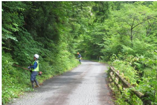
林道沿線の草刈り作業