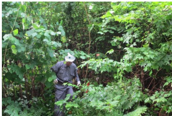
林道沿線の修景作業