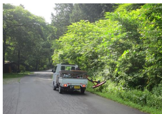
軽トラックによる草刈作業