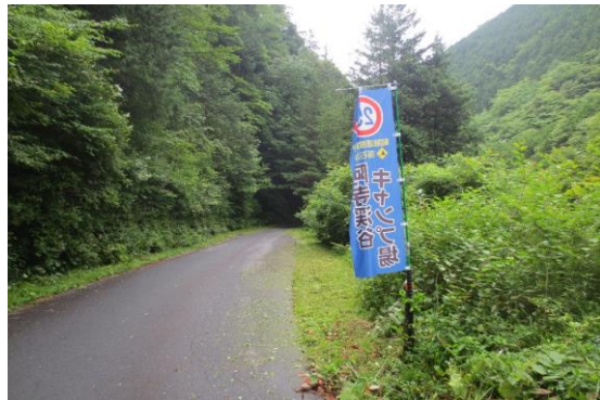
作業終了後の状況