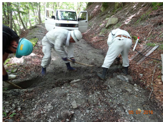
【土砂等の取り除き中】