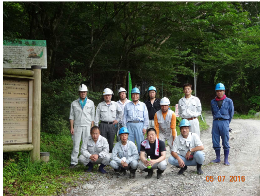
【作業開始前：集合写真】