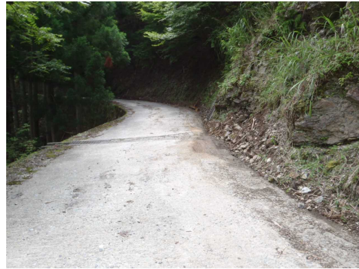
【落石を取り除いた状況】