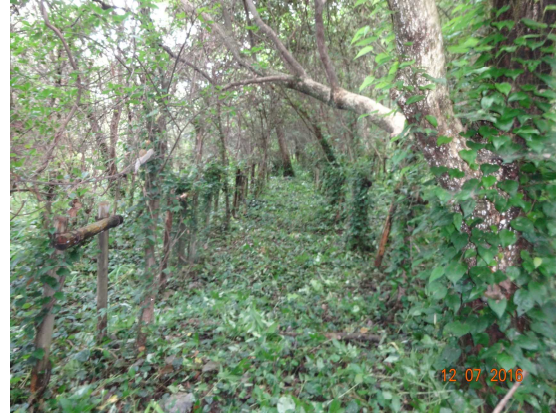
【活動終了箇所の状況】