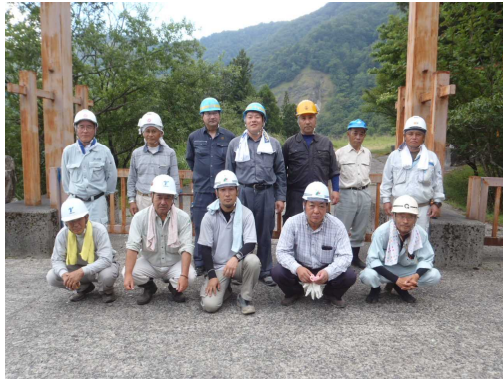
【作業開始前：集合写真】