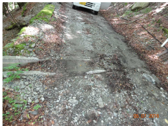
【横断工に詰まった土砂等の状況】