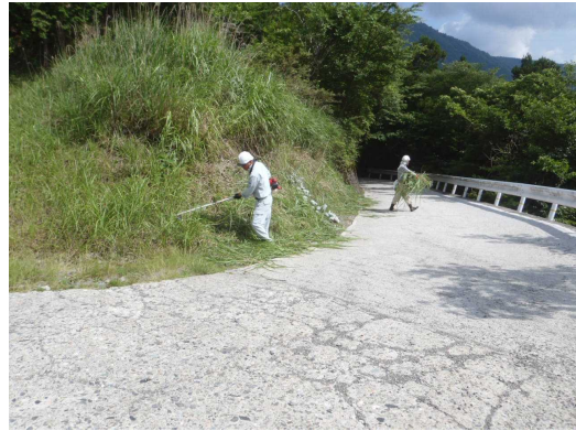
【雑草の刈払い作業中】