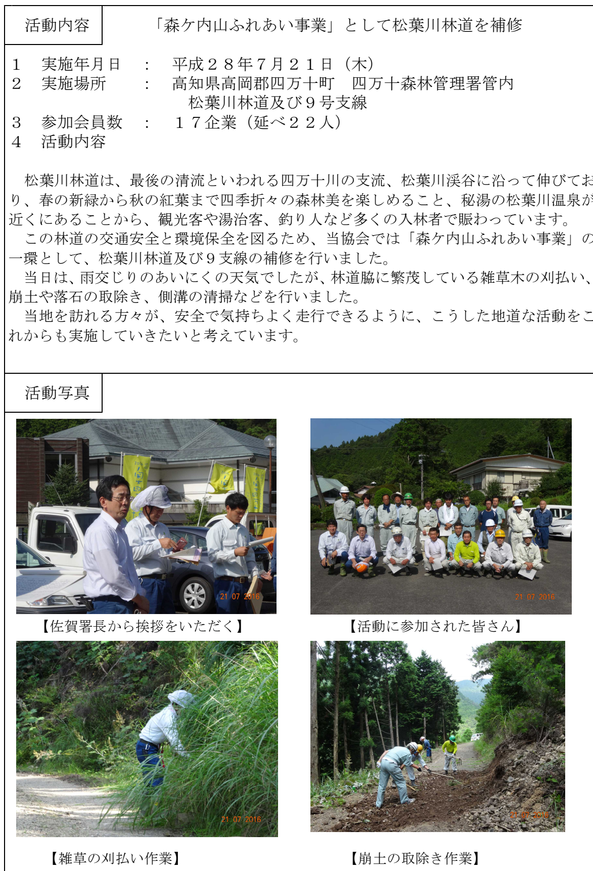
【佐賀署長から挨拶をいただく】