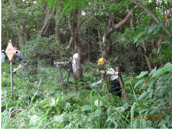
【下刈作業の活動中】