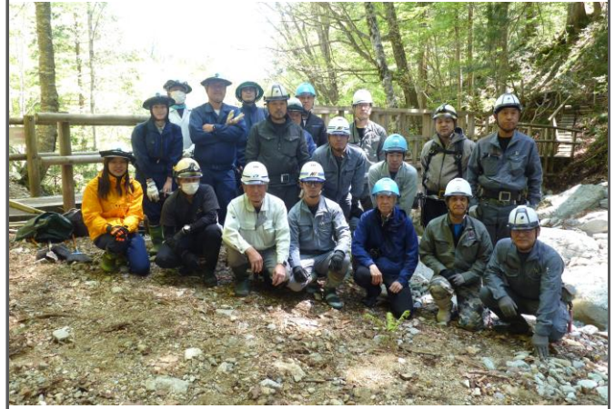
作業を終えて参加者一同