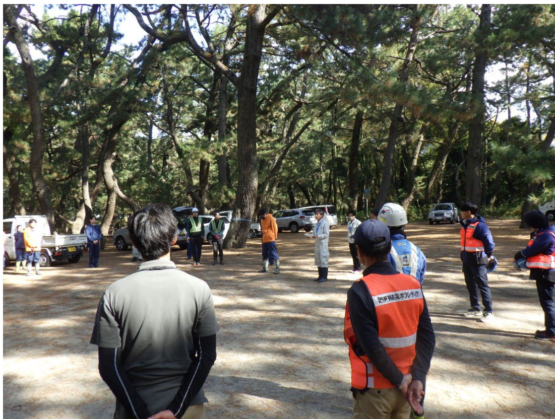
作業後の唐津市役所からの挨拶