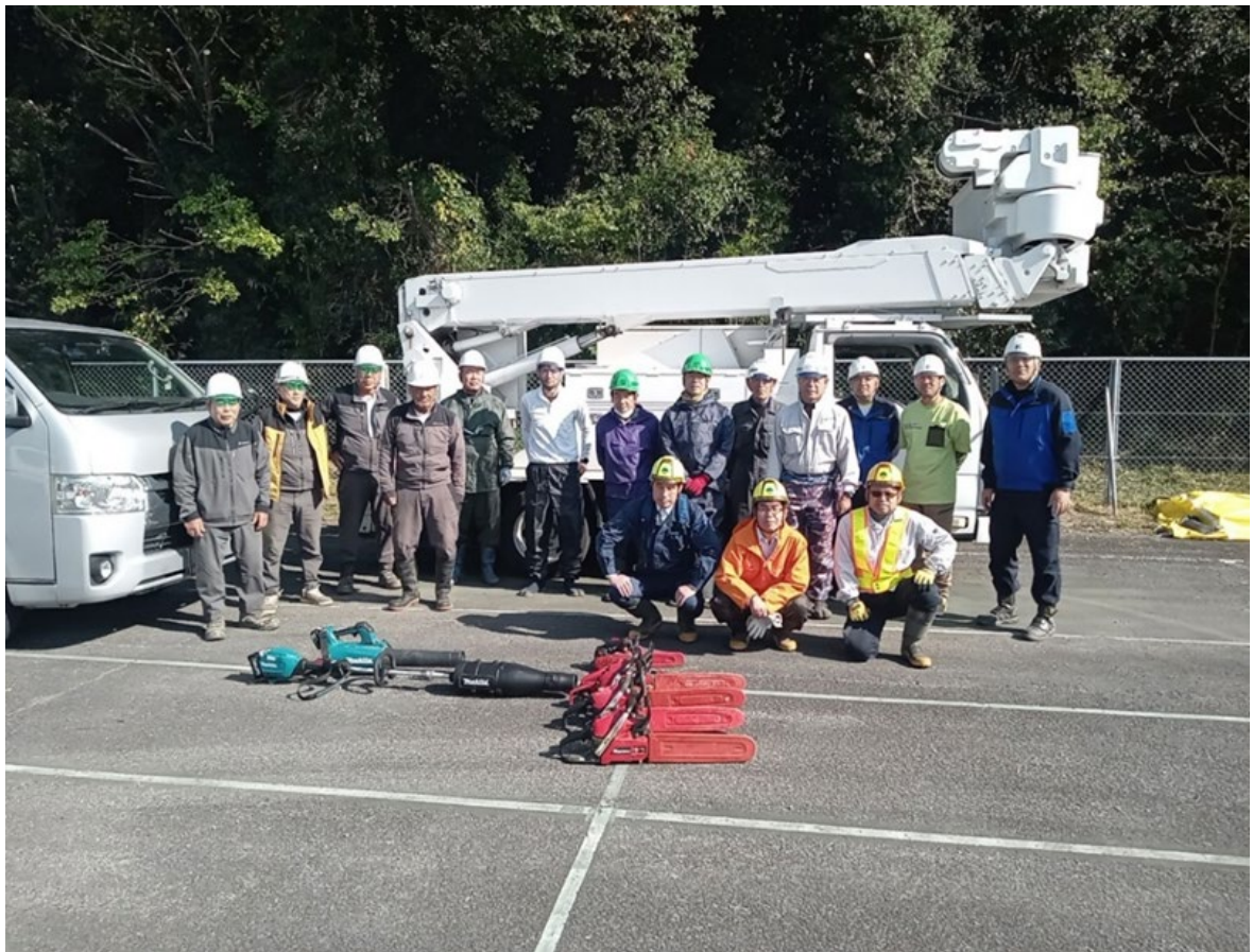
活動に参加した皆さん