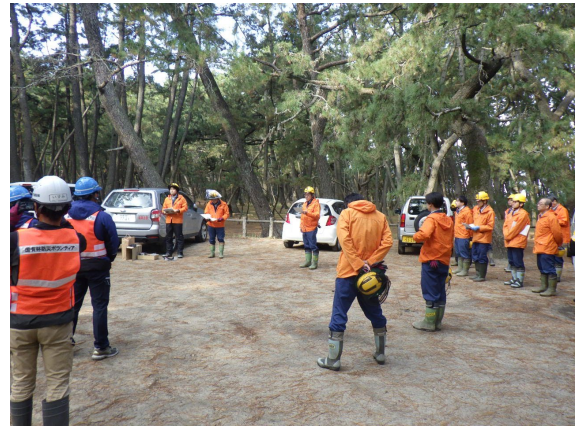
作業前のミーティング