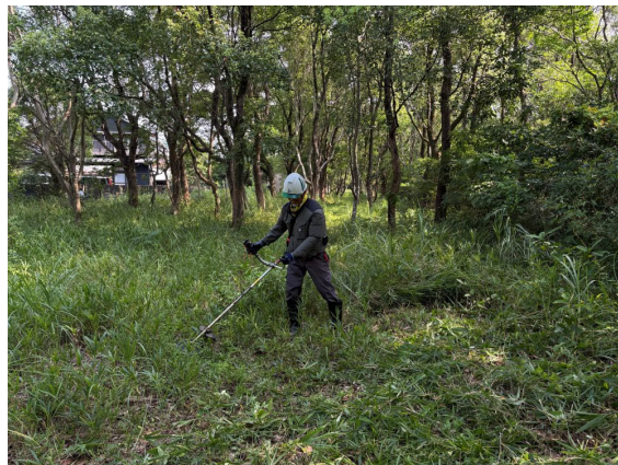
刈り払い作業の様子