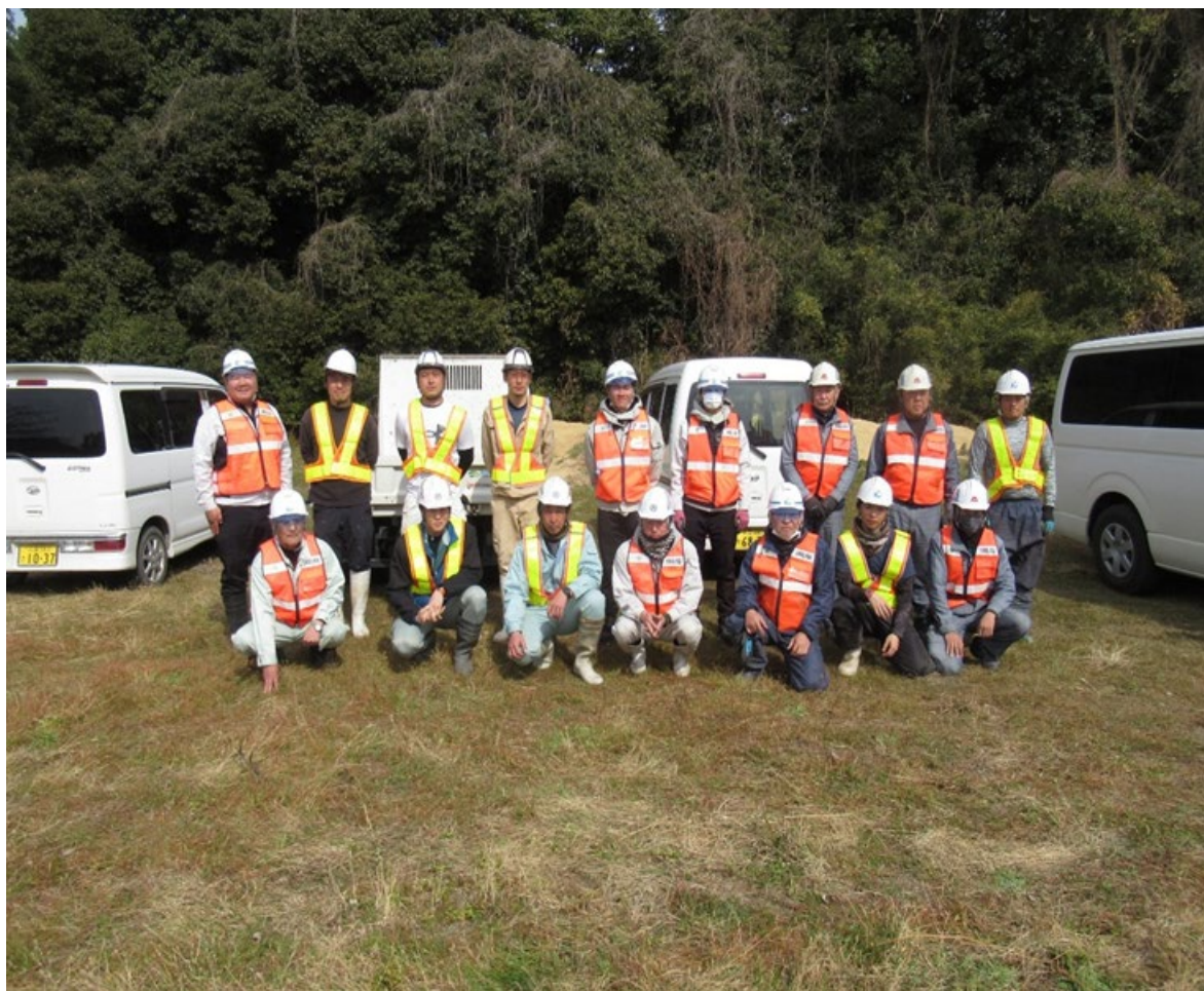
作業に参加した皆さん