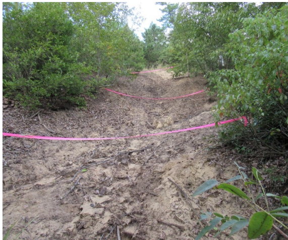
土砂流出防止柵（木柵）施工前