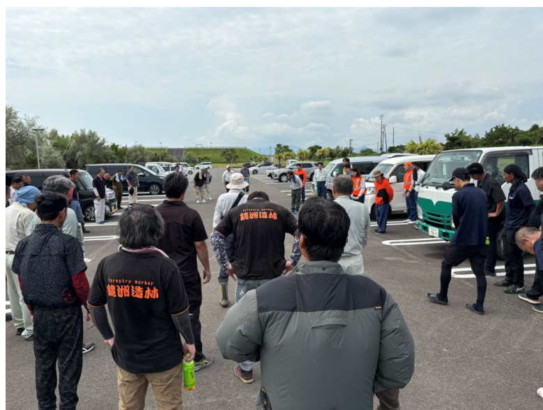
作業後のミーティング