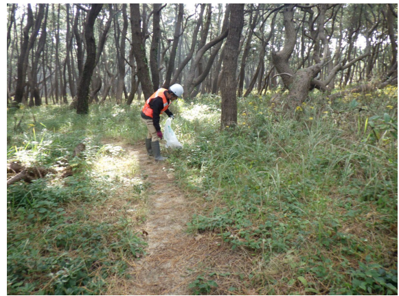
投棄ゴミ等の回収作業の様子