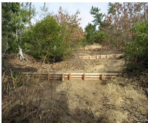
土砂流出防止柵（木柵）施工後