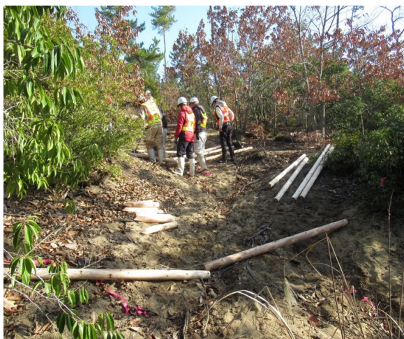
土砂流出防止柵（木柵）施工中