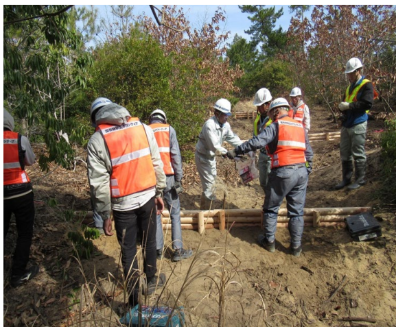
土砂流出防止柵（木柵）施工中