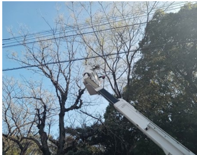
危険木処理の様子（高所作業車使用）