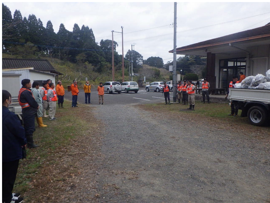
作業終了後のミーティング