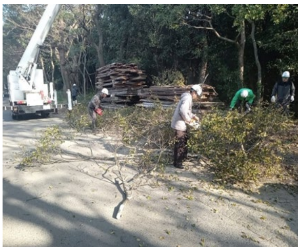
伐採した枝条の処理状