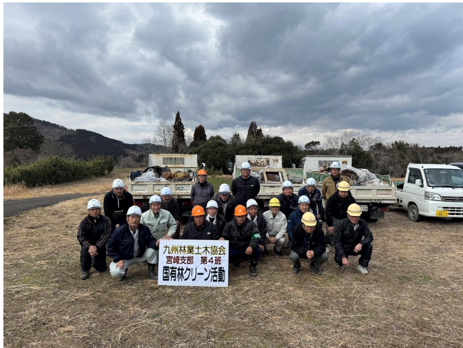
活動に参加した会員企業の皆さん