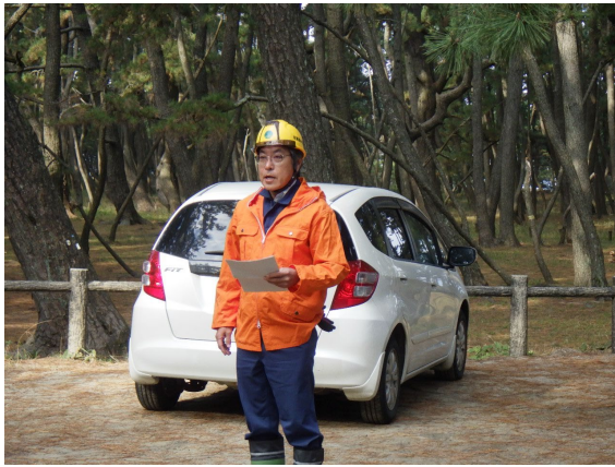
作業前の森林管理署長挨拶