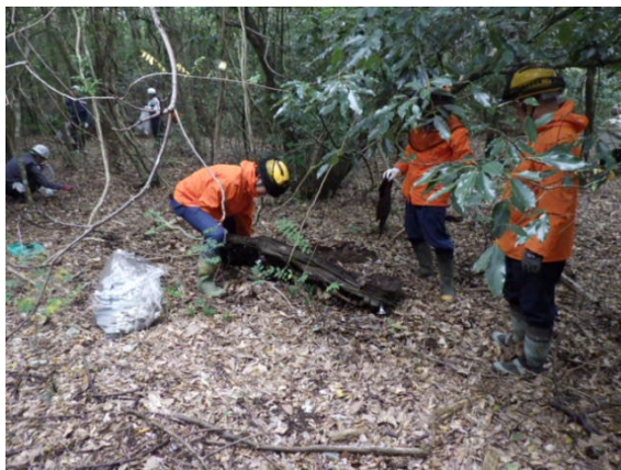
不法投棄物の回収作業の様子