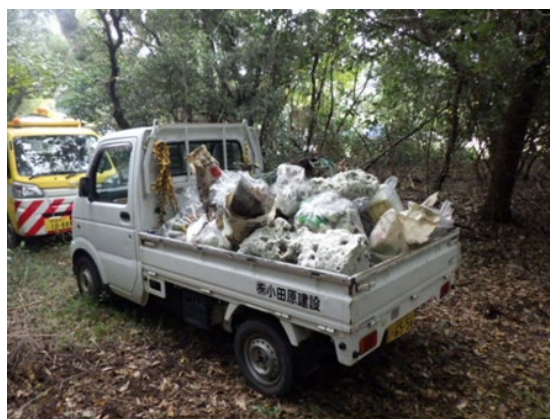
回収した投棄ゴミの積み込み