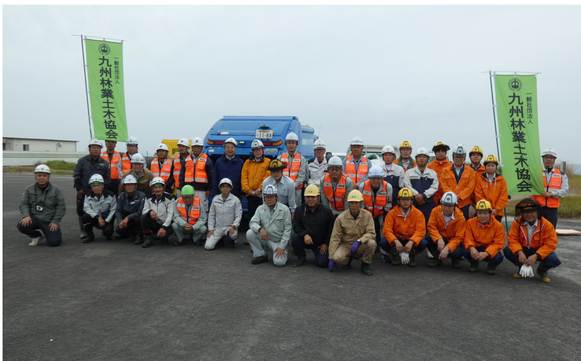
活動に参加した皆さん