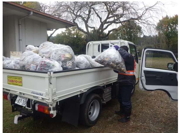
回収したゴミの積込状況