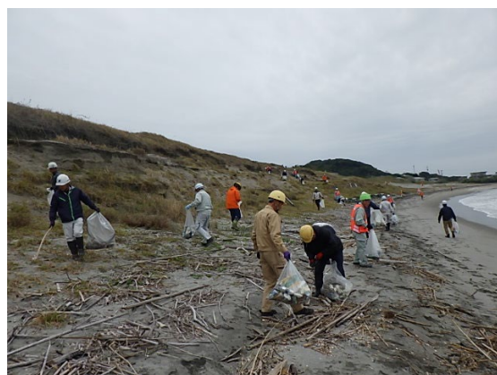
海岸に打ち上げられた ゴミの回収作業の様子