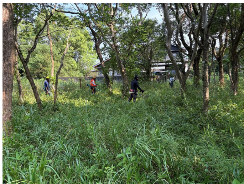
刈り払い作業の様子