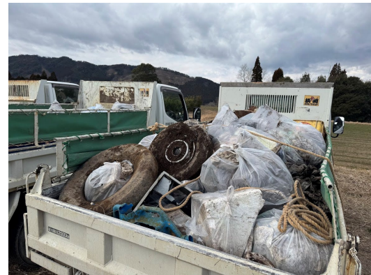
回収した廃棄物の積み込み状況