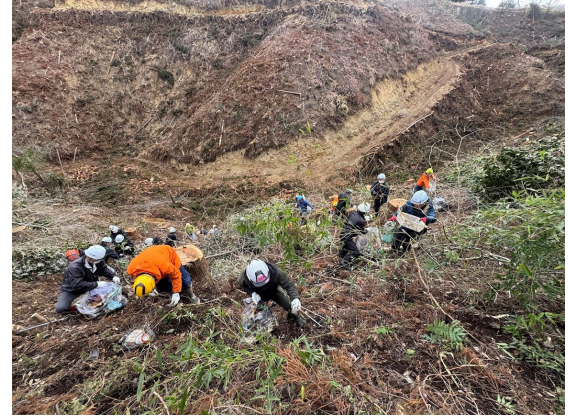
廃棄物の回収作業の様子