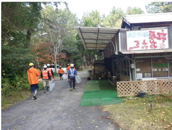
投棄ゴミ等の回収作業の様子