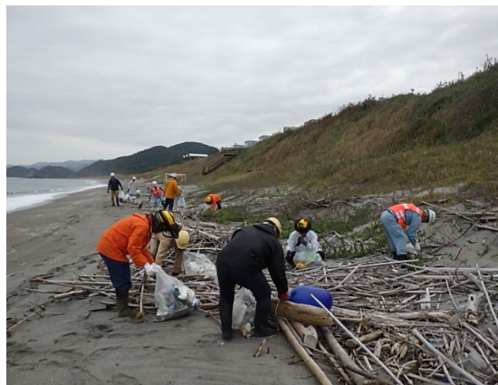
海岸に打ち上げられた ゴミの回収作業の様子