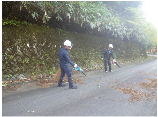
林道脇の清掃作業