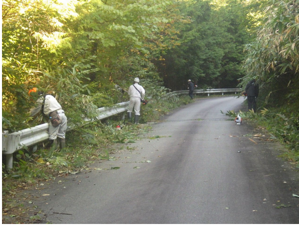
林道路肩の除草作業