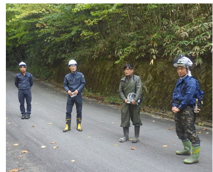
森林管理署長の挨拶