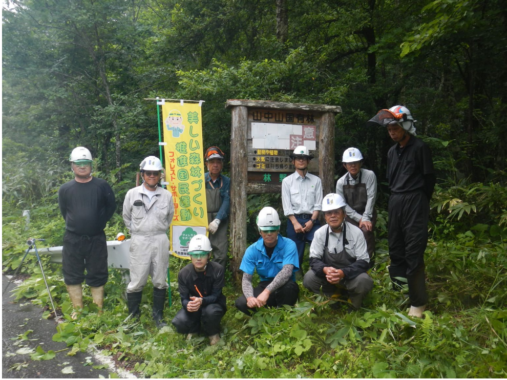
活動に参加された皆さん