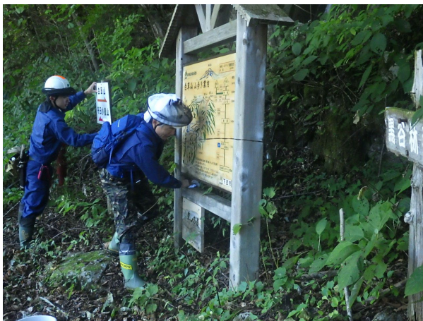
登山道入口の看板の清掃