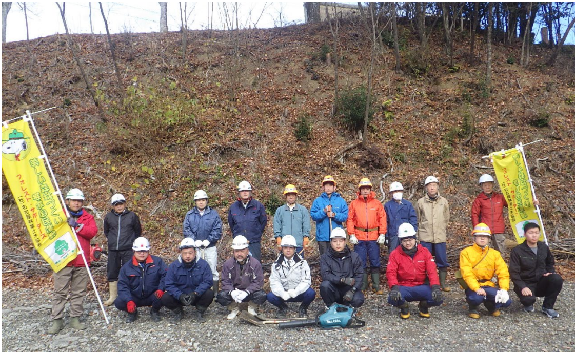
活動に参加された皆さん