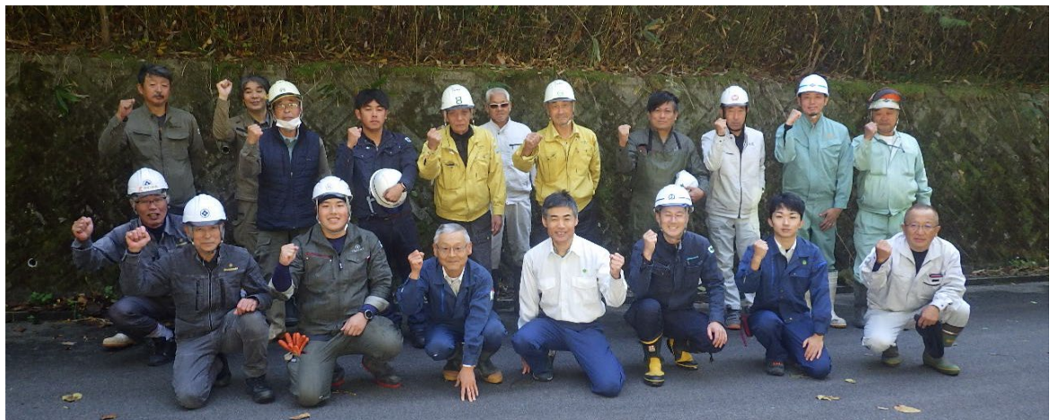
活動に参加された皆さん