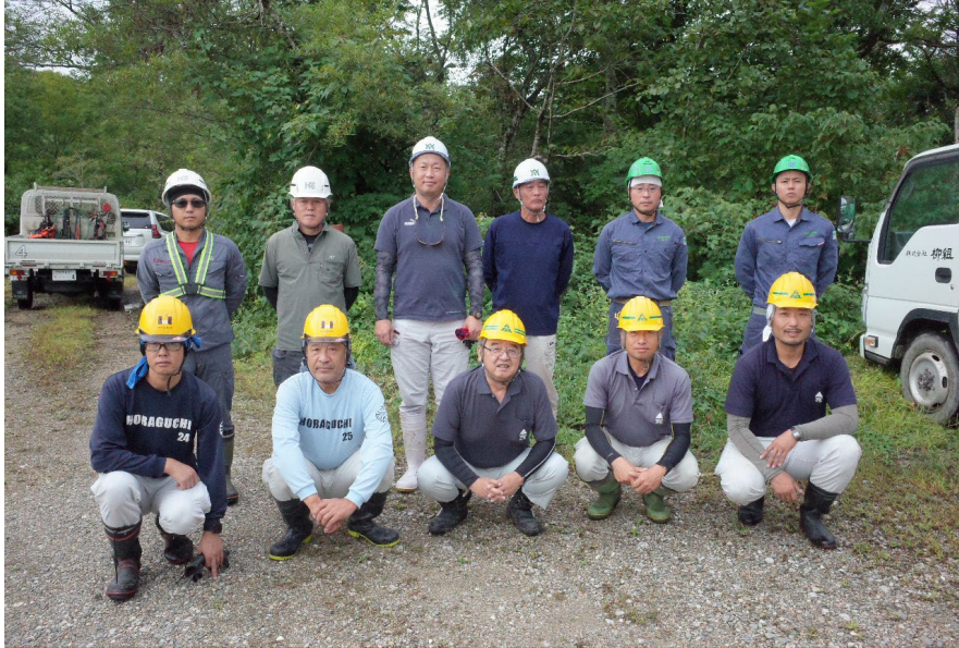
作業に参加した古川支部の皆さん