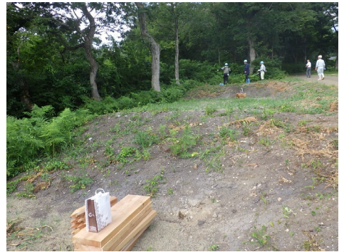
階段作設前の状況