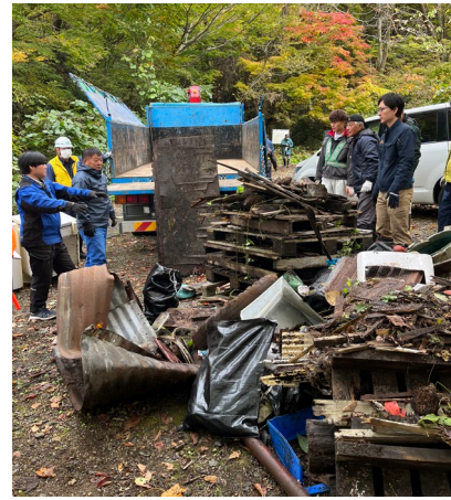
回収された廃棄物