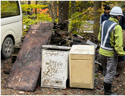
回収された廃棄物