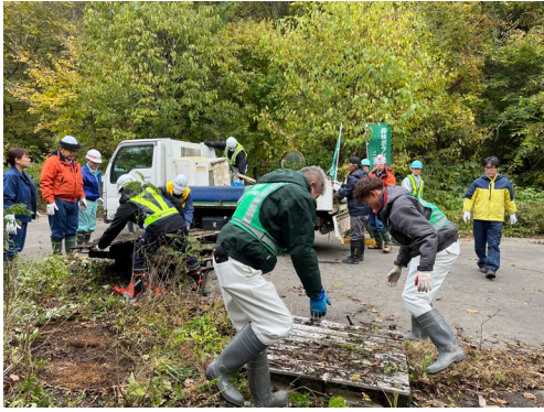
ゴミの回収作業状況