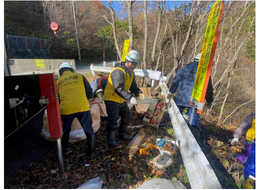
斜面からのゴミ回収