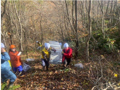
ゴミの回収作業状況