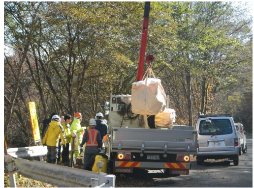
トラックに積まれる廃棄物