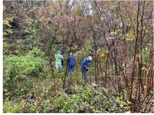
ゴミの回収作業状況