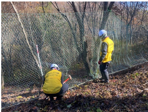
不法投棄防止柵の設置