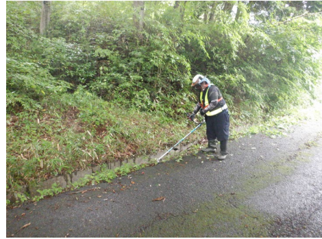
除草作業実施状況