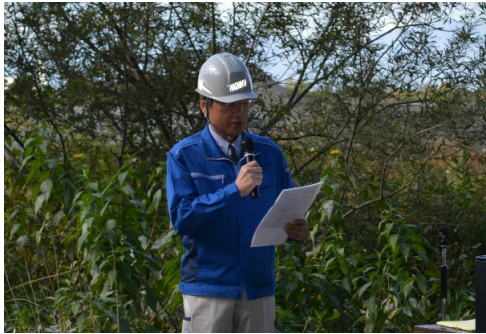
当協会会長の挨拶