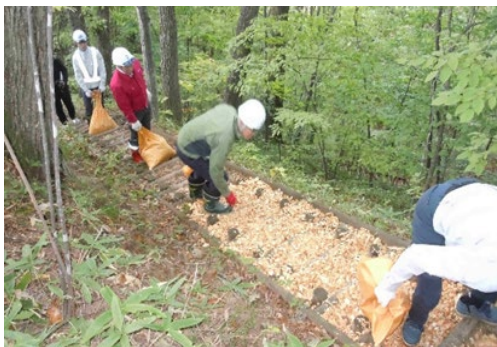
ウッドチップの敷き均し作業