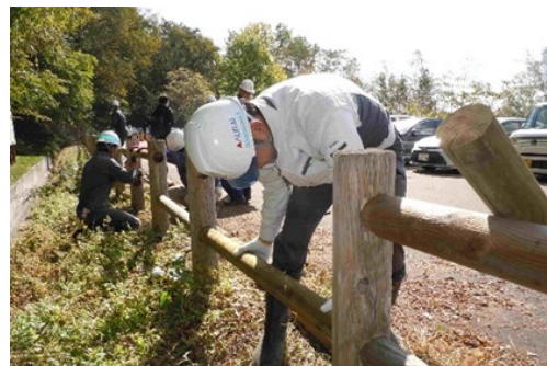
駐車場の木柵交換作業