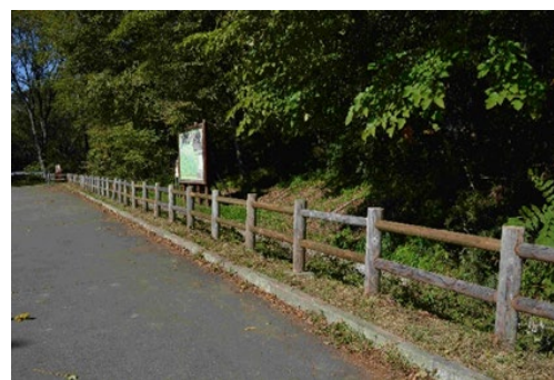
補修された駐車場の木柵