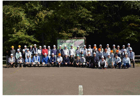
活動に参加した皆さん