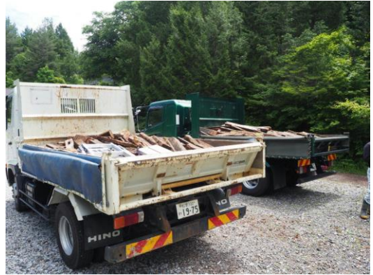
トラックに積込完了