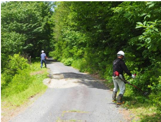
治山運搬路の草刈