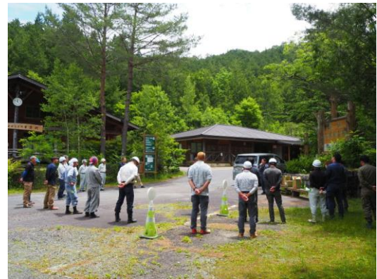
協会木曾支部長の作業終了あいさつ