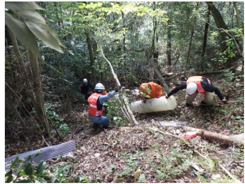
投棄ゴミの回収作業