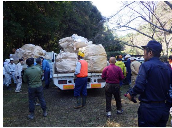
回収された廃棄物