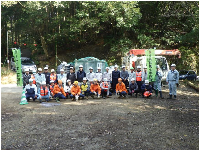
活動に参加された皆さん