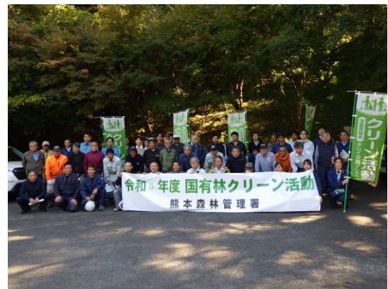
活動に参加された皆さん