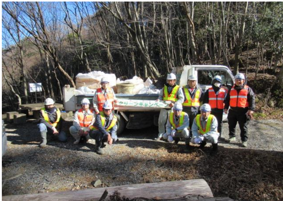
活動に参加された皆さん