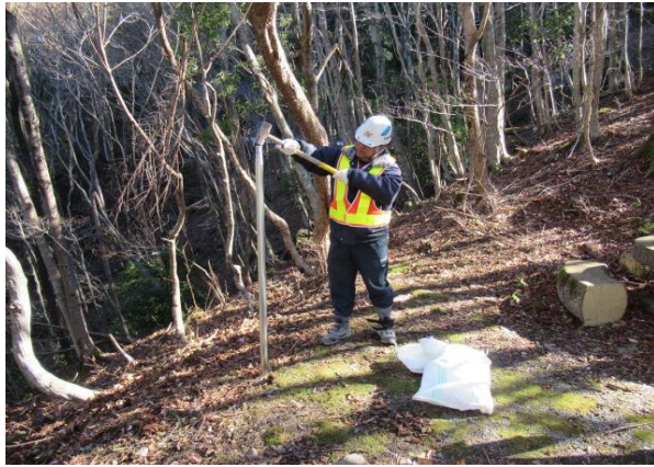
不法投棄防止の看板設置作業