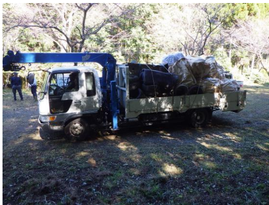
回収された廃棄物