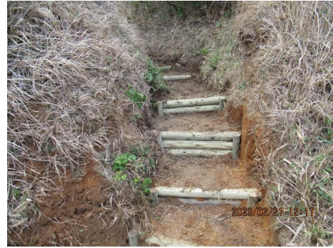
木製階段設置後の遊歩道