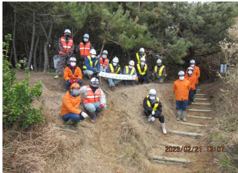
活動に参加された皆さん