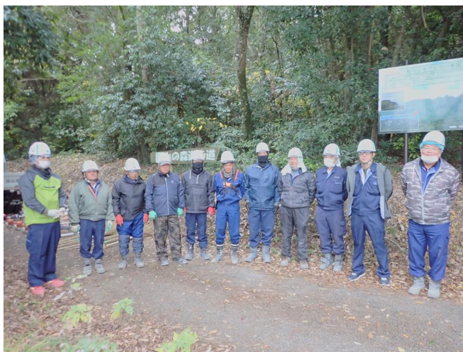
活動に参加された皆さん