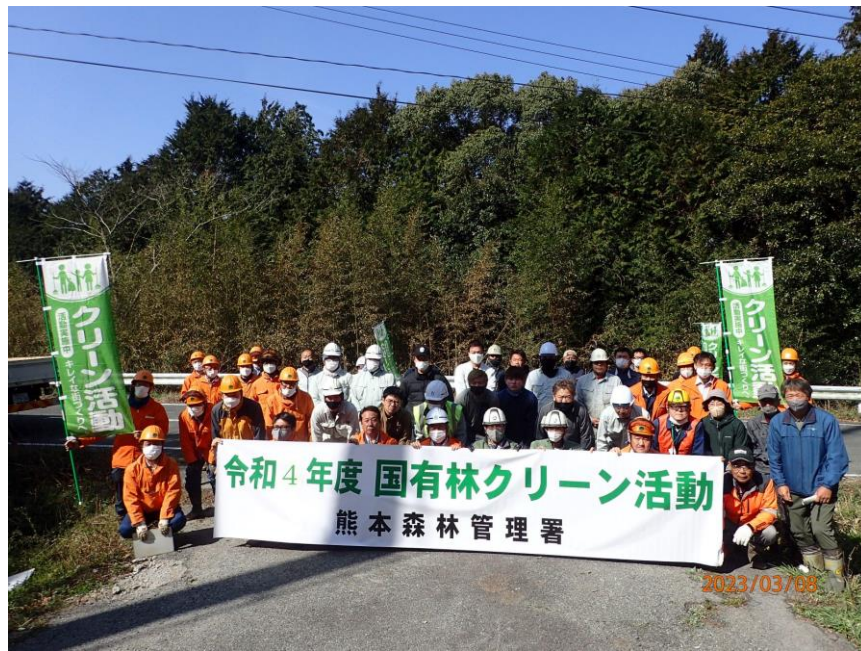
活動に参加された皆さん