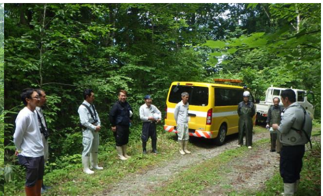
作業完了後ミーティング