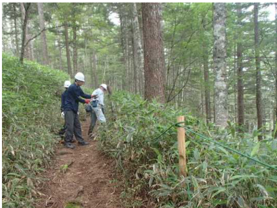
杭の交換とロープの締め直し