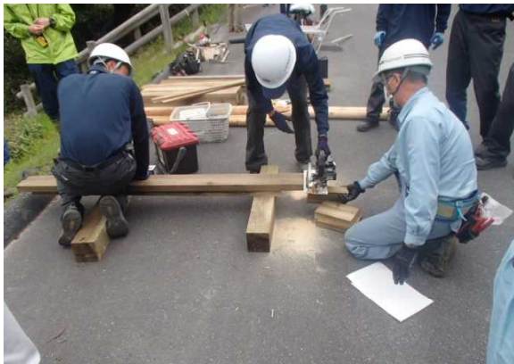
看板用の資材の加工