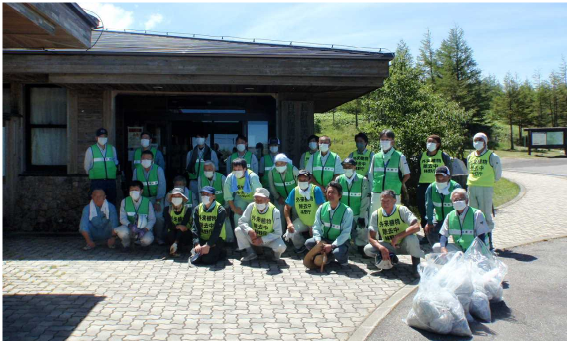
作業に参加された皆さんと回収されたゴミ