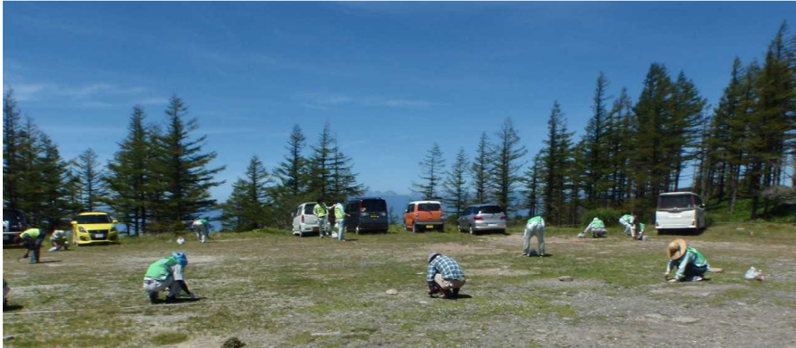
外来種セイヨウタンポポの抜き取り作業