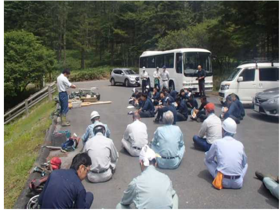
森林管理署による森林教室