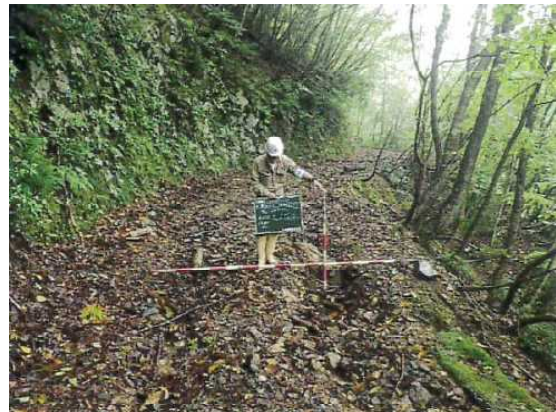
福井署 野鹿谷林道 路面洗堀状況