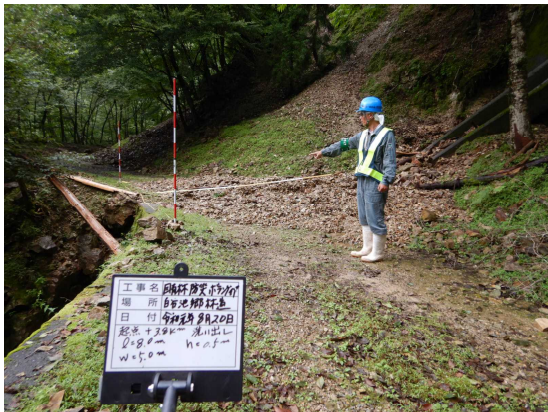
奈良所 白谷池郷林道 崩土及び路肩決壊